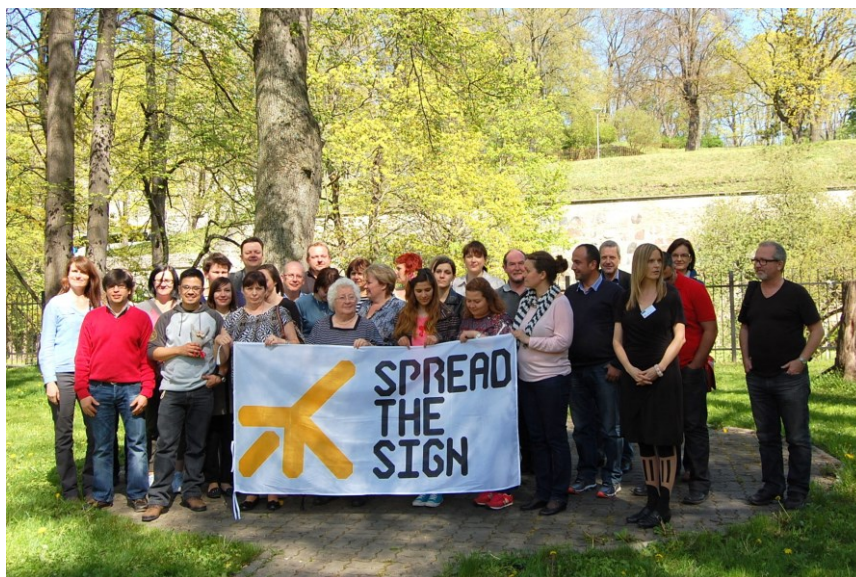
Společné foto partnerů na setkání v Estonsku