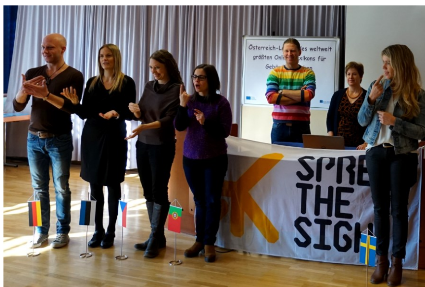
Tisková konference na setkání v Rakousku