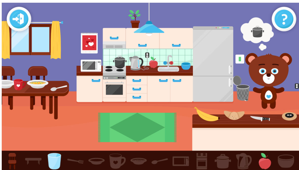
Obr.2: Ukázka prostředí „KUCHYŇ“