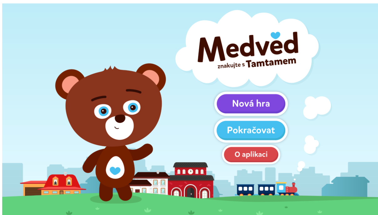
Obr.1: Úvodní obrazovka aplikace

Již třetí aplikace Centra pro dětský sluch Tamtam je tentokrát určena především neslyšícím dětem do osmi let. Mohou ji však využít i starší děti, slyšící děti, jejich rodiče a kdokoli, kdo se chce jednoduchou a hravou formou s pomocí tabletu seznámit se základními znaky českého znakového jazyka. Medvěd má podobu obrázkového slovníku a neobsahuje žádné textové informace. Na děti čekají tři různá prostředí (kuchyň, doprava, školka). V každém hledají jednotlivé předměty, po nalezení se objeví obrázek předmětu a video se znakem, který ukazují dětské figuranti. Ve druhé, čistě zábavní části, se děti o medvídku starají – čistí mu zoubky, převlékají ho, ukládají ke spánku apod. Zacházení s aplikací je velmi intuitivní, aby ji mohly bez problémů používat i ty nejmenší děti, bez asistence rodičů. Aplikace je určena pro tablety s operačním systémem Android a iOS a je zdarma ke stažení na Google Play a App Store.