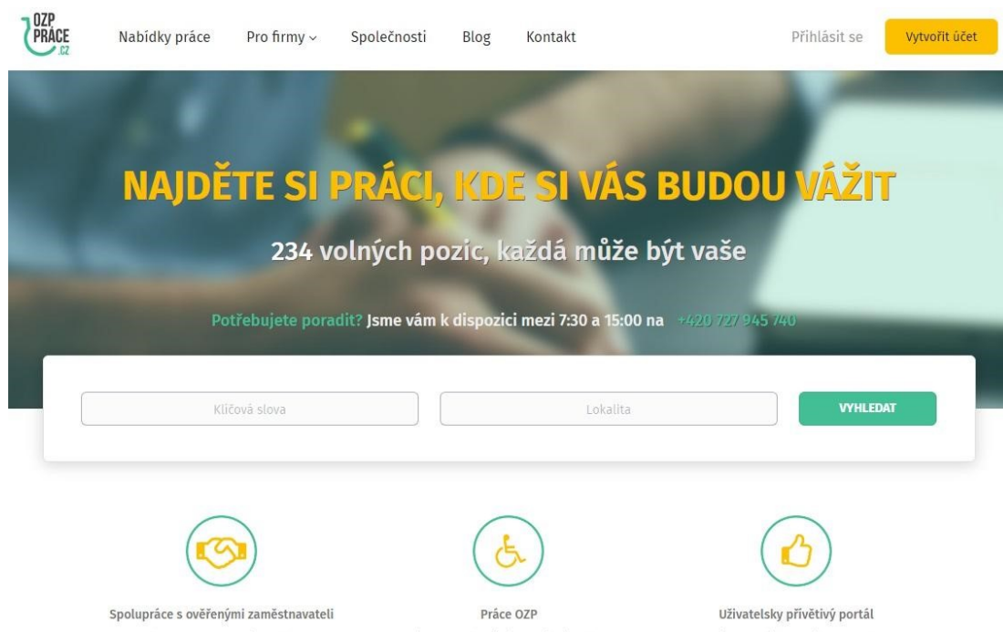
Obr. 2: OZP portál po inovaci v roce 2017

A takto vypadá dnes po inovaci ke konci roku 2017: