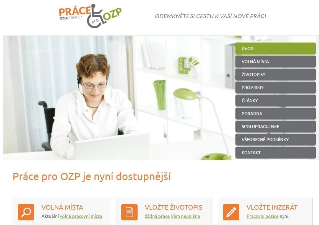
Obr. 1: OZP portál v roce 2014

Takto vypadal vzhled našeho portálu v roce 2014: