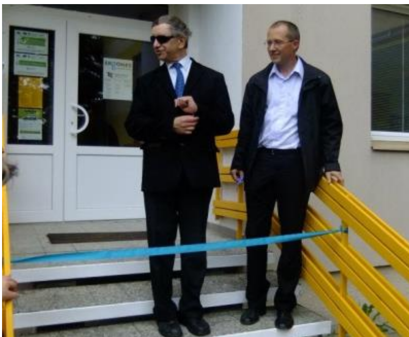
Obr.1: Slavnostní otevření Ergonesu