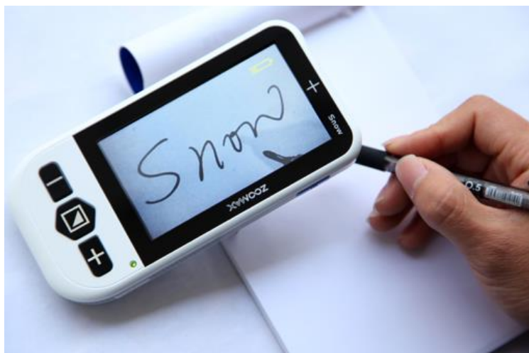
Obr.7: Kompenzační pomůcka - přenosná kamerová lupa