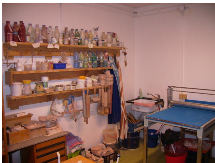
Obr.3: Pohled do keramické dílny