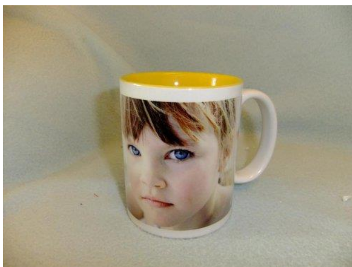
Obr.5: Hotový potisk na hrnku