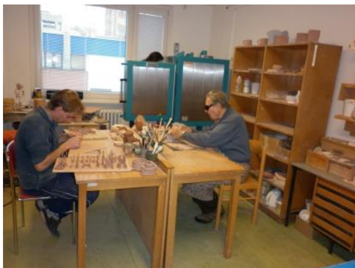
Obr.2: Pracovníci v keramické dílně