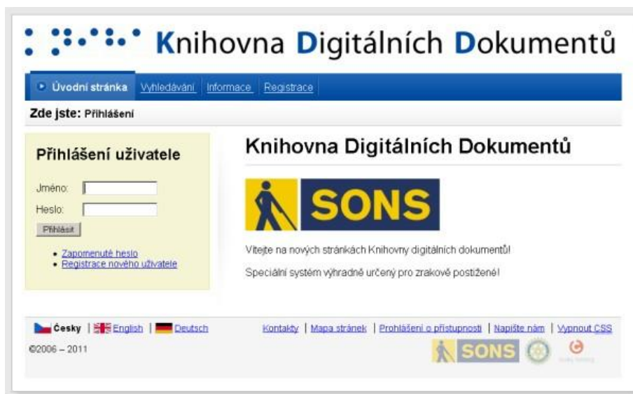
Obr. 2: Nové webové rozhraní Knihovny