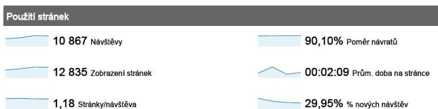
Tab.1: Statistika WEBlíky 1. 9. 2009 – 31. 12. 2009.