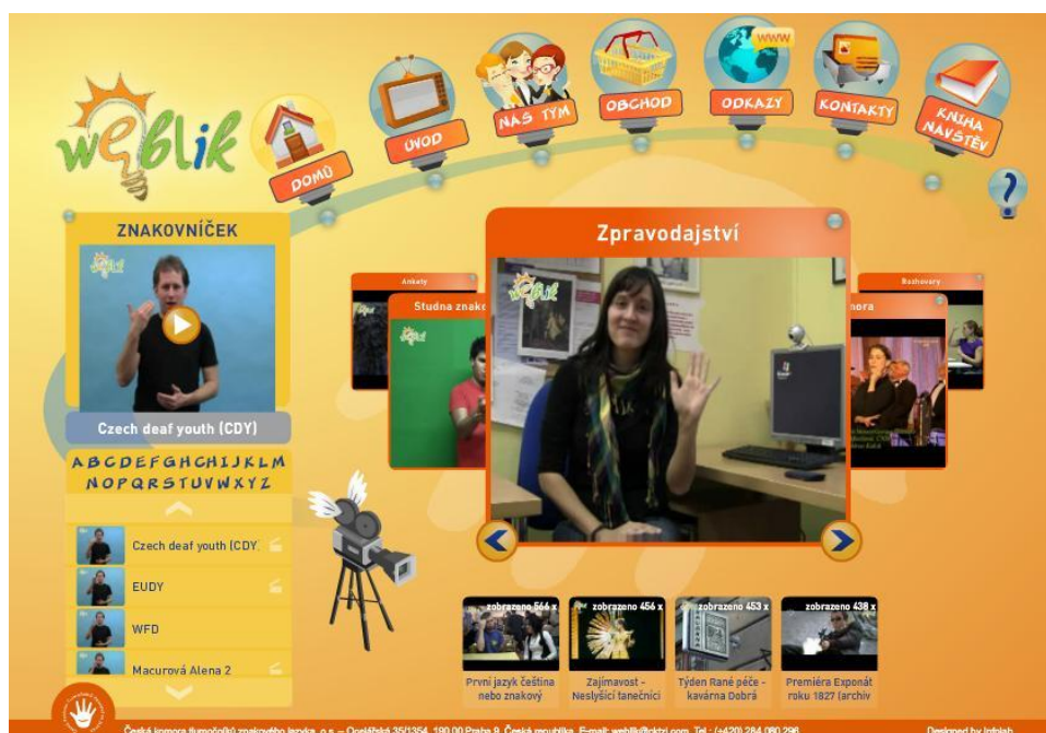
Obr. 1: WEBlik – hlavní stránka.